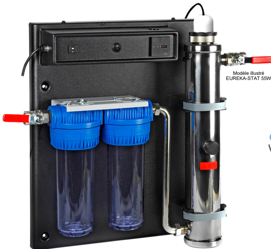
Modèle illustré EUREKA-STAT 55W